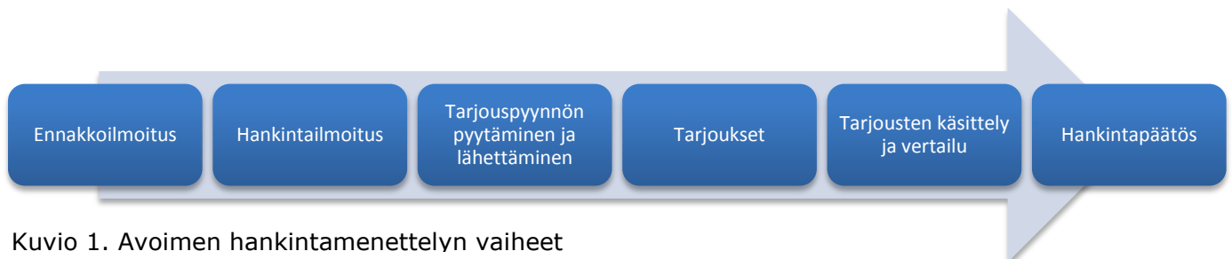
Kuvio 1. Avoimen hankintamenettelyn vaiheet

Avoimessa menettelyssä kaikki halukkaat tarjoajat voivat pyytää hankintailmoituksen perusteella tarjouspyyntöasiakirjat ja voivat jättää tarjouksen. Tämän lisäksi hankintayksikkö voi toimittaa tarjouspyyntöasiakirjat soveliaiksi katsomilleen toimittajille. Avoimen menettelyn vaiheet on kuvattu kuviossa 1.