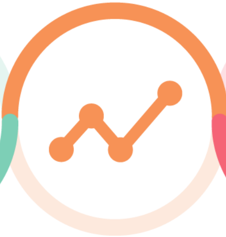
Tieto- ja analyysipalvelut