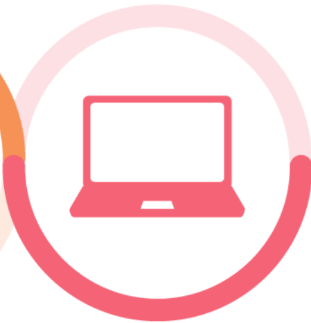
Välineitä hankintojen tekemiseen