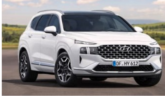
Hyundai Santa Fe