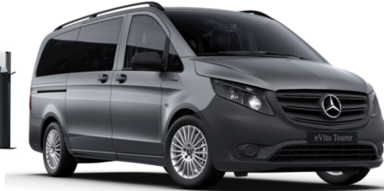
Mercedes-Benz Vito / V