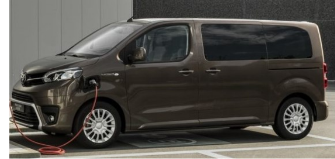
Toyota Proace Verso