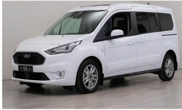
Ford Grand Tourneo Connect