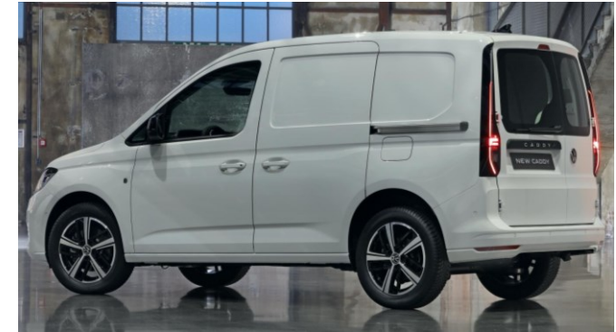
Volkswagen Caddy Cargo