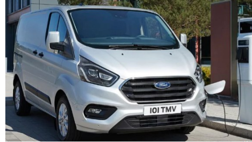
Ford Transit Custom